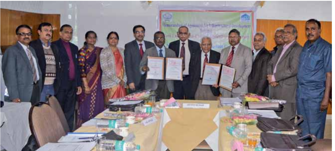
प्रबंध मंडल की दूसरी बैठक के दौरान आरएलबीसीएयू और एनबीसीसी के बीच समझौता ज्ञापन का आदान-प्रदान

वित्त समिति और प्रबंध मंडल ने क्रमशः दिनांक 21.09.2015 व 10.02.2016 को आयोजित अपनी बैठकों में प्रशासनिक ब्लॉक, शैक्षणिक ब्लॉक, पुस्तकालय, संकाय सदस्यों के आवासों, अतिथि गृह, वैज्ञानिक आवास, अंतर्राष्ट्रीय अतिथि गृह, छात्रावासों,