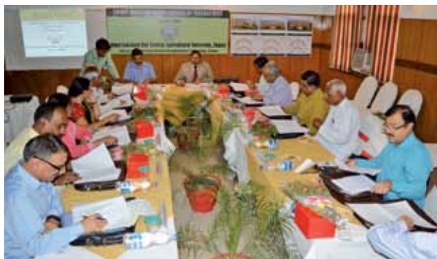
प्रबंध मंडल की तृतीय बैठक का एक दृश्य