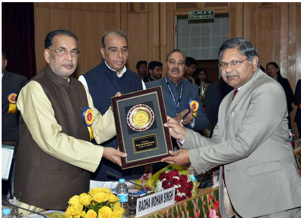
Sri Radha Mohan Singh, Hon'ble Minister of Agriculture and Farmers' Welfare presenting the award

innovations like Agriculture Education Day, e-Courses, National Talent Scholarship for P.G. students and new UG courses for much needed reforms to generate quality human resources for science led revolution in agriculture.