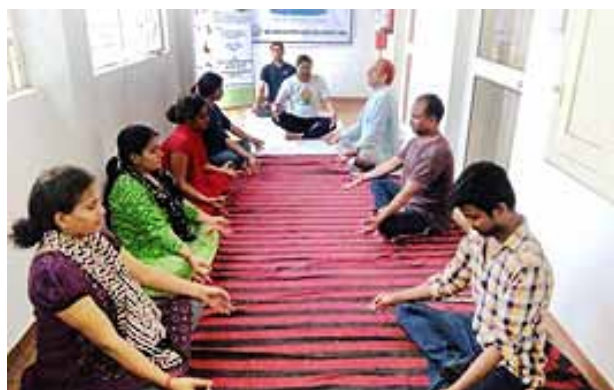
Yoga for Harmony and Peace

Yoga is a holistic science of life, which deals with physical, mental, emotional and spiritual health. It is based on an extremely subtle science which focuses on bringing harmony between mind and body. Yoga also enhances teamwork and communication. The International Day of Yoga is now celebrated world-over annually on 21 st June since its inception in 2015. The University decided to take forward the momentum created by