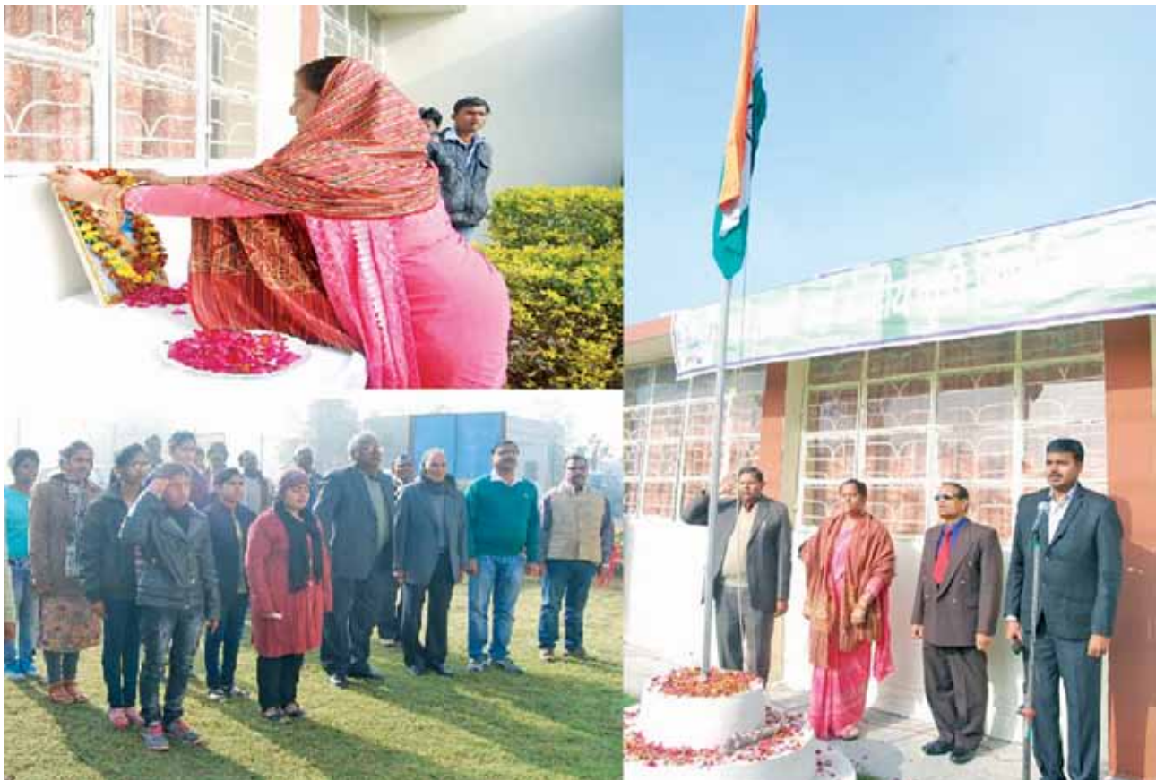
Glimpses of Republic Day celebrations