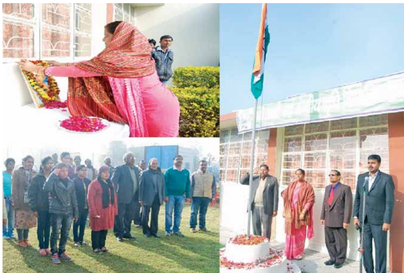
गणतंत्र दिवस समारोह की झलकियां